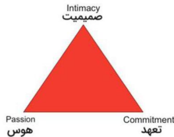
شکل ۱- سه وجه مثلث عشق از دیدگاه استرنبرگ